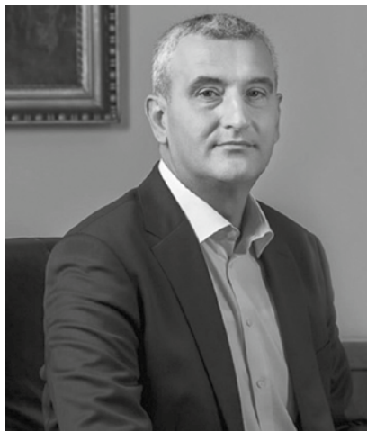
Gradonačelnik Damir Mandić, dipl. teol.

Vjerujem kako ćemo zajedničkim snagama pozitivno rješavati sve izazove koji pred nas dođu. Neka vam ovaj Gradski program za mlade bude motivacija i za nasljeđe budućim generacijama.